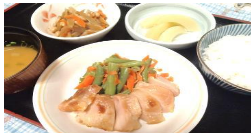
特別養護老人ホーム極楽苑 【鶏の柚子こしょう焼き・白桃】

そろそろ梅雨があける頃となりました。今回のお食事は、極楽苑では、鶏の柚子こしょう焼き・白桃、高齢者福祉施設香流川では、菜めし・鶏肉のトマトソースがけ、高齢者住宅西山では、枝豆ご飯・味噌カツと、初夏を感じて頂ける栄養満点のメニューをご用意させて頂きました。