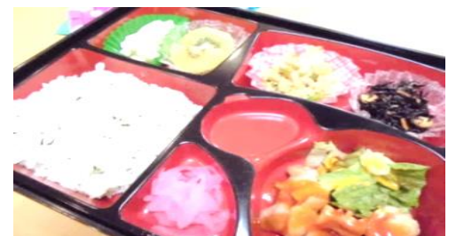
高齢者福祉施設香流川 【菜めし・味噌カツ】