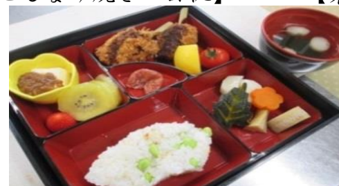
高齢者住宅西山 【枝豆ご飯・味噌カツ】